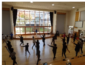
ダンシングヒーロー